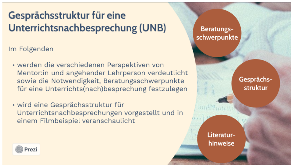
Abbildung 2: Ausschnitt aus der interaktiven Präsentation (Lernfeld „Rolle“)